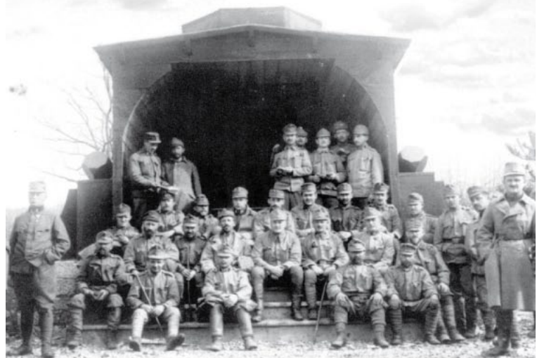
Hölzerne Synagoge auf der Hochebene Doberdob im Jahr 1915. Lesena sinagoga na Doberdobski planoti leta 1915.

Judovski vojaki avstro-ogrske vojske na soški fronti Jüdische Soldaten der österreichisch-ungarischen Armee an der Isonzofront